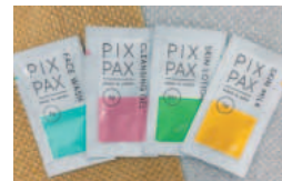
豊富なアメニティバイキング