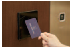
安心のセキュリティ

すばらしい眠りをもたらす品質の高さで、世界に選ばれてきたシモンズベッドを全室に導入。