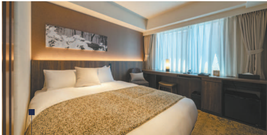
モデレートダブル